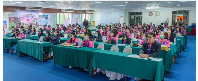
การอบรมเชิงปฏิบัติการและการนำเสนอ Best Practice ณ โรงแรมสกลแกรนด์พาเลซ จังหวัดสกลนคร