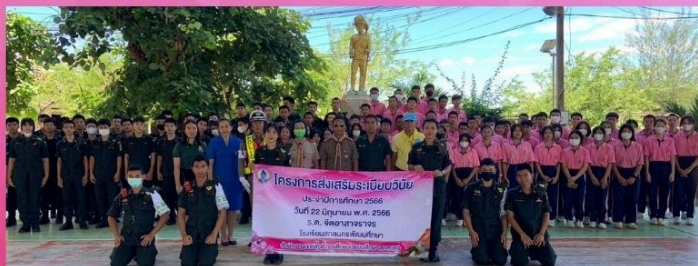
โครงการส่งเสริมระเบียบวินัย ประจำปีการศึกษา 2566 วันที่ 22 มิถุนายน พ.ศ. 2566 ณ อาคารเอนกประสงค์ 39 ปี โรงเรียนสกลนครพัฒนศึกษา