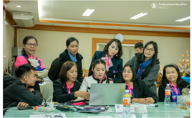
อบรมปฏิบัติปฏิบัติการเพื่อพัฒนาทักษะในศตวรรษที่ 21 ด้วยกิจกรรม Active Learning ผ่านกระบวนการ PLC ณ ห้องประชุมพระธาตุมูม โรงเรียนสกลนครพัฒนศึกษา