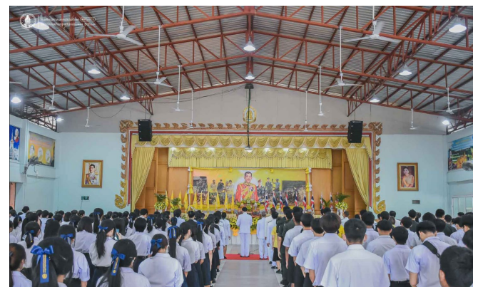
กิจกรรมเฉลิมพระเกียรติพระบาทสมเด็จพระเจ้าอยู่หัว เนื่องในโอกาสวันเฉลิมพระชนมพรรษา ๒๘ กรกฎาคม ณ หอประชุม โรงเรียนสกลนครพัฒนศึกษา