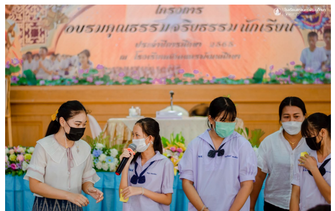
โครงการอบรมคุณธรรมจริยธรรมนักเรียน เพื่อส่งเสริมคุณธรรมจริยธรรมสามารถดำเนินชีวิตได้อย่างมีความสุข ณ หอประชุมพระธาตุจตุม โรงเรียนสกลนครพัฒนศึกษา