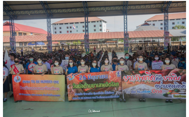
กิจกรรมเดินรณรงค์เนื่องในวันต่อต้านยาเสพติด ณ สนามกีฬาเทศบาลสกลนครและอาคารโดมเอนกประสงค์ โรงเรียนสกลนครพัฒนศึกษา