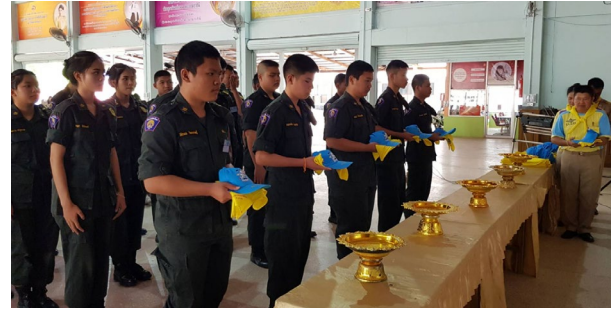
กิจกรรมสร้างและส่งเสริมความเป็นพลเมืองดีตามรอยพระยุคลบาท ณ หอประชุม โรงเรียนสกลนครพัฒนศึกษา